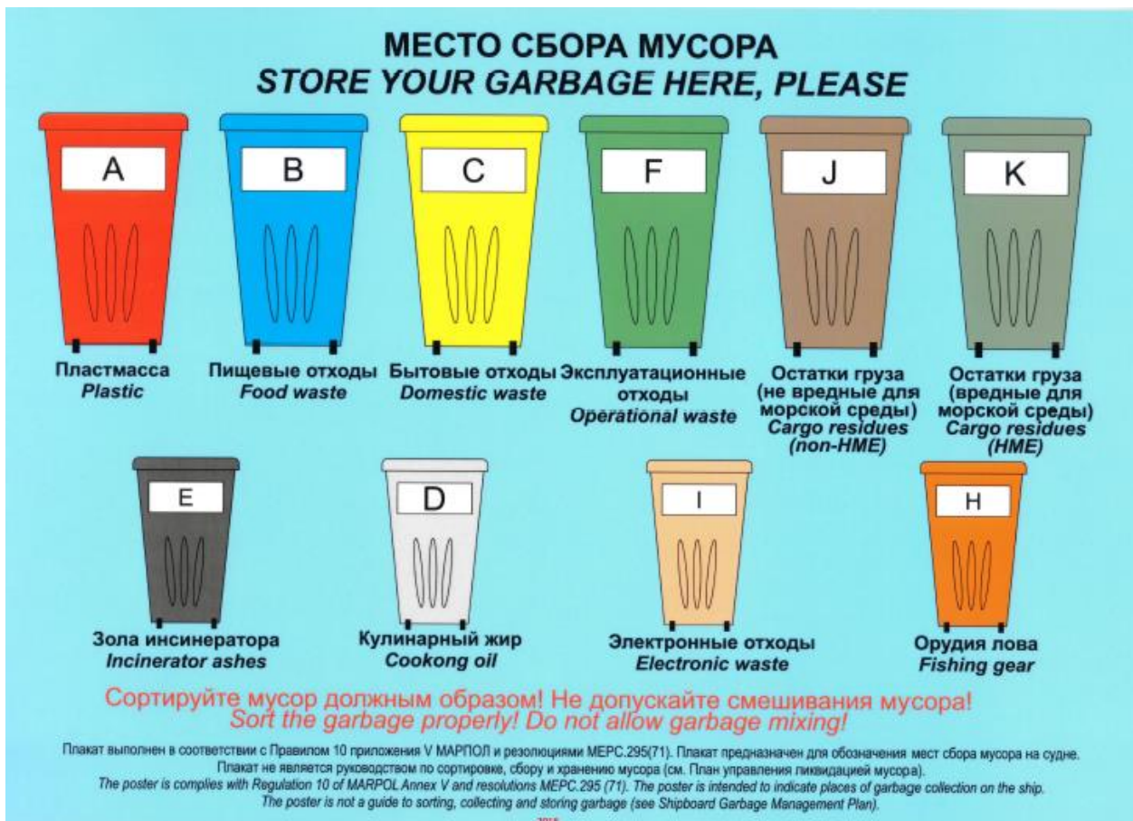
Схема 1. Сортировка отходов по категориям

Судовой мусор, образовавшийся в результате жизнедеятельности экипажей судов и накапливающийся в контейнерах, установленных на причалах, по мере накопления собирается операторами причалов и вывозится на основании заключенных договоров.